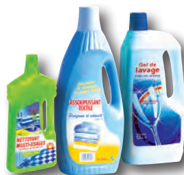
flacons de produits ménagers