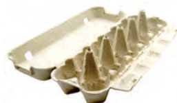
boîtes à œufs

Je ne mets pas > À jeter dans votre poubelle habituelle