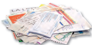
courriers, lettres, impressions