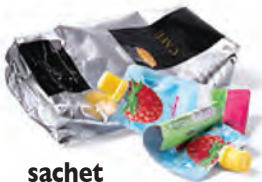
sachet de café et compote