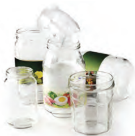
bocaux et pots