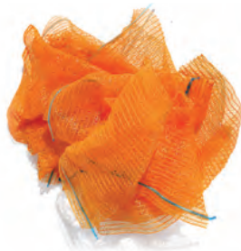
Filets de pommes de terre