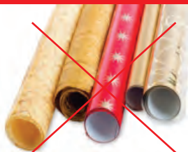
Papiers cadeau brillant

Je ne mets pas > À jeter dans votre poubelle habituelle