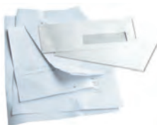
papiers bureau, enveloppes