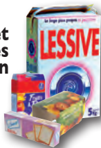
boîtes et suremballages en carton