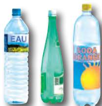
bouteilles en plastique: eau, jus de fruit, soda...