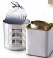
boîtes de conserve et boîtes à thé