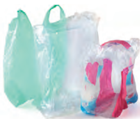
Suremballages, sacs et films en plastique