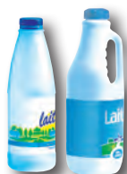
bouteilles de lait

je mets, les BOUTEILLES , les FLACONS et les EMBALLAGES en PLASTIQUE en vrac et vides .