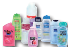
flacons de produits d'hygiène