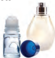
flacons de parfum

Je ne mets pas > À jeter dans votre poubelle habituelle