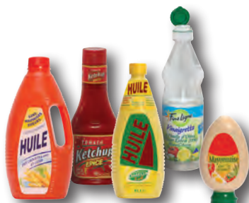
bouteilles d'huile, mayonnaise, vinaigrette, ketchup, ...